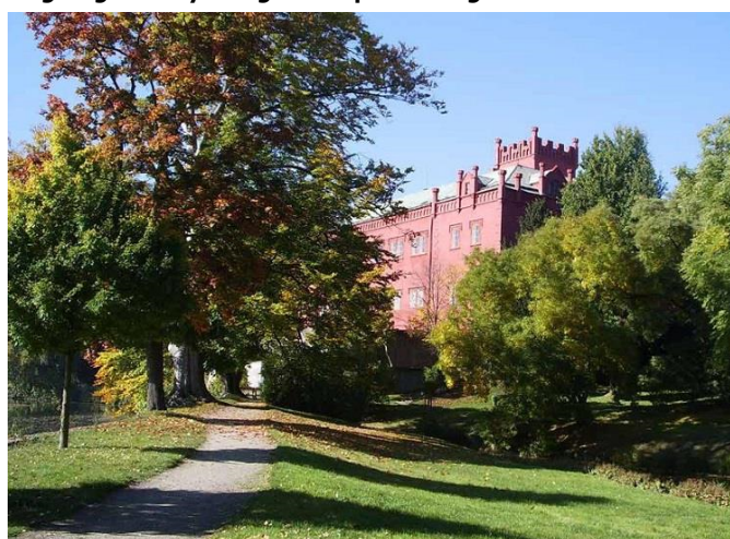
PRŮVODCE ZÁMECKÝM PARKEM V KLÁŠTERCI NAD OHŘÍ