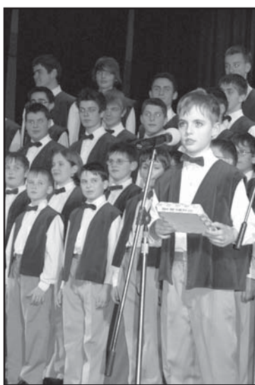
■ Boni Pueri

První část večera byla věnována klenotům klasické hudby, v té druhé zazněly písně z celého světa zpívané v rozmanitých jazycích. Chlapci si suverénně poradili nejen s temperamentní itáličtinou a měk-