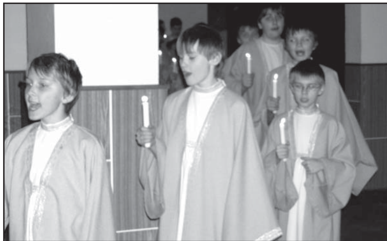
■ Efektivní nástup chlapeckého sboru na scénu kulturního domu

kou ruštinou, ale i s exotickou japonštinou. Pro většinu přítomných to byly jistě krásně strávené dvě hodiny. Dlouhý a nadšený potlesk, který chlapce při odchodu provázel, patřil nejen jejich talentu, ale v případě těch nejmenších i jejich neskutečné roztomilosti. -lara-