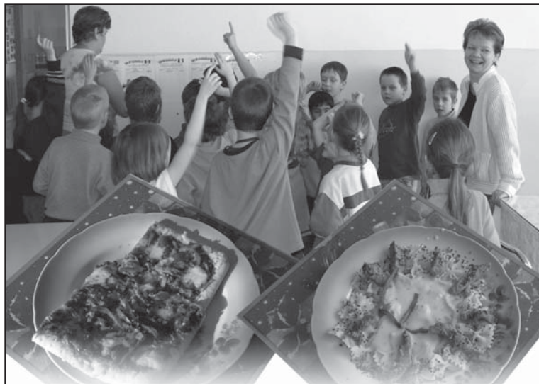
■ Nová jídla mohli žáci posoudit nejen svými chuťovými buňkami, ale také měli možnost o každém jídle hlasovat. Pizza to vyhrála na plné čáře.