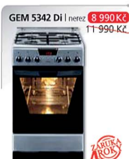
GEM 5342 Di | nerez 8 990 Kč 11 990 Kč

Multifunkční trouba – 8 funkcí Energetická třída A Elektronický programátor Ta s displejem Elektrické zapalování v knoflíku Plynová varná deska Rozměry v cm v/š/h: 85 x 50 x 60 cm