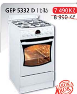
GEP 5332 D | bílá 7 490 Kč 8 990 Kč

Multifunkční trouba – 8 funkcí Energetická třída A Elektronický programátor Ta Elektrické zapalování v knoflíku Plynová varná deska Rozměry v cm v/š/h: 85 x 50 x 60 cm