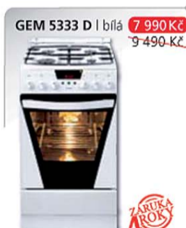
GEM 5333 D | bílá 7 990 Kč 9 490 Kč

Multifunkční trouba – 8 funkcí Energetická třída A Elektronický programátor Ta Elektrické zapalování v knoflíku Plynová varná deska Rozměry v cm v/š/h: 85 x 50 x 60 cm