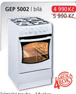
GEP 5002 | bílá 4 990 Kč 5 990 Kč

Multifunkční trouba – 8 funkcí Energetická třída A Elektronický programátor Ta Elektrické zapalování v knoflíku Plynová varná deska Rozměry v cm v/š/h: 85 x 50 x 60 cm