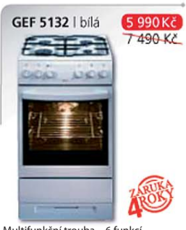
GEF 5132 | bílá 5 990 Kč 7 490 Kč

Elektrická trouba – 3 funkce Energetická třída A Konvenční ohřev: horní a dolní topné těleso Elektrické zapalování Plynová varná deska Rozměry v cm v/š/h: 85 x 50 x 60 cm