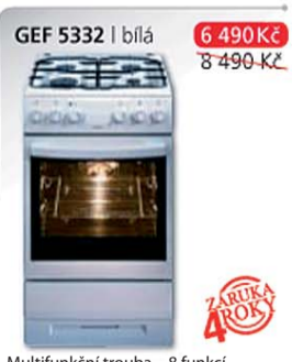
GEF 5332 | bílá 6 490 Kč 8 490 Kč

Multifunkční trouba – 6 funkcí Energetická třída A Elektrický gril 2000 W Elektrické zapalování v knoflíku Plynová varná deska Rozměry v cm v/š/h: 85 x 50 x 60 cm