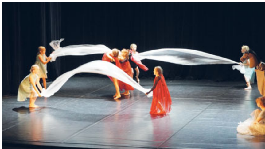
Souboj vody a ohně v podání Divadélka pod ZUŠkou

Naše základní umělecká škola „ZUŠka“ má za sebou vydařený školní rok a čile se připravuje na ten nadcházející.