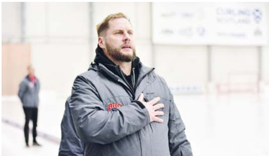
Ondřej Kalců – brankář české reprezentace v bandy hokeji