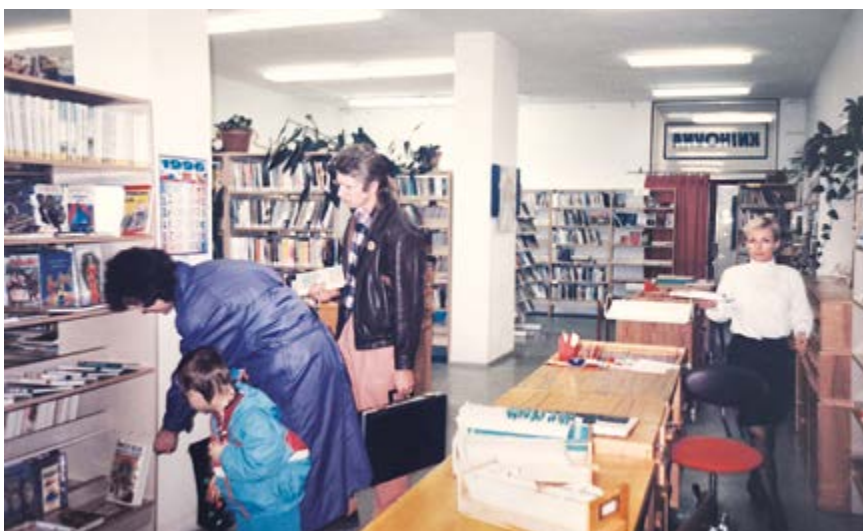
Pobočka v Polní ulici v 90. letech 20. století

Dnes nabízí nejen rozsáhlý fond čítající desítky tisíc knih a periodik, ale i moderní zázemí pro čtenáře všech generací.