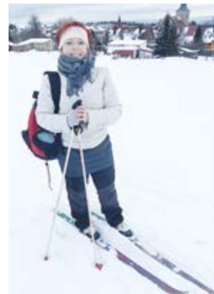
Běžky a turistiku řadí mezi své největší koníčky