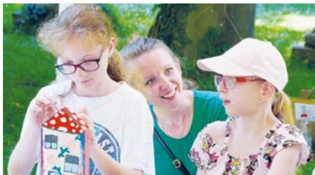
Tvůrčí dílny během sochařského sympozia v roce 2024

Od 15. do 18. června jsou pro školáky prvního stupně základních škol připraveny výtvarné dílny , které