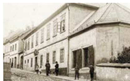
Klášterecká farní knihovna založená v roce 1805