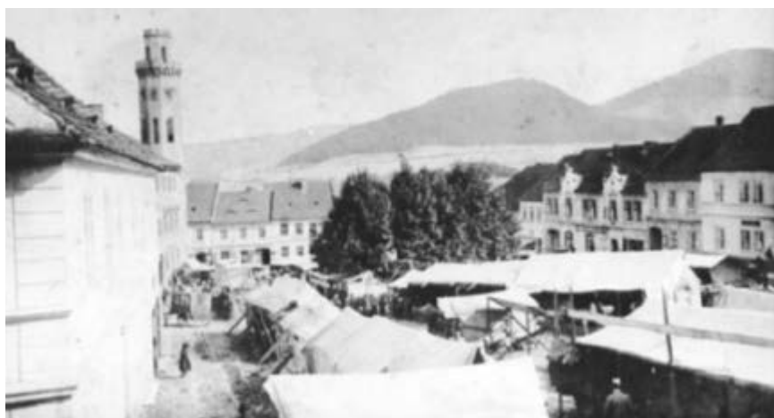
30. léta 20. století – trh na náměstí

Rok 2026 přináší v historii Klášterce nad Ohří řadu zajímavých výročí. Připomínají důležité události, osobnosti i proměny města od středověku až po moderní dobu.