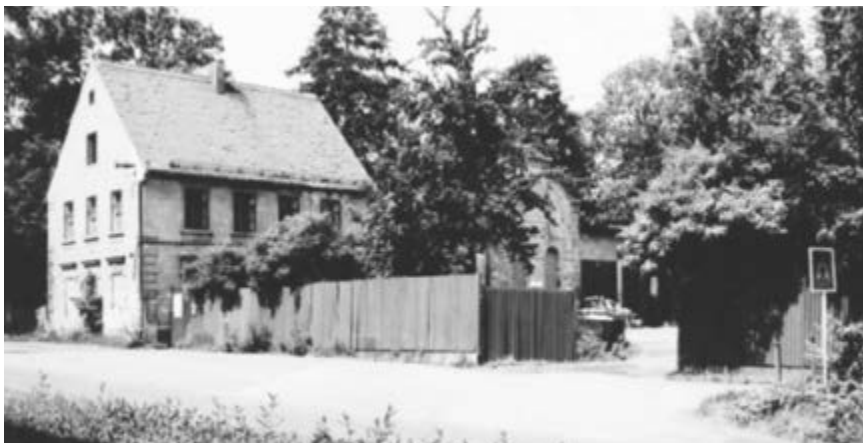
70. léta 20. století – kovošrot v budově bývalých městských jatek

Z roku 1731 pochází zmínka o prvním známém kláštereckém lékaři Konradu Gollovi . Letos tak uplyne 295 let od této zmínky, která dokládá postupnou profesionalizaci zdravotní péče ve městě.