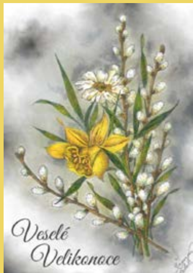
Šimon Čekal – velikonoční přání

6. dubna – Pondělí v oktávu velikonočním 9:30 hodin – mše svatá