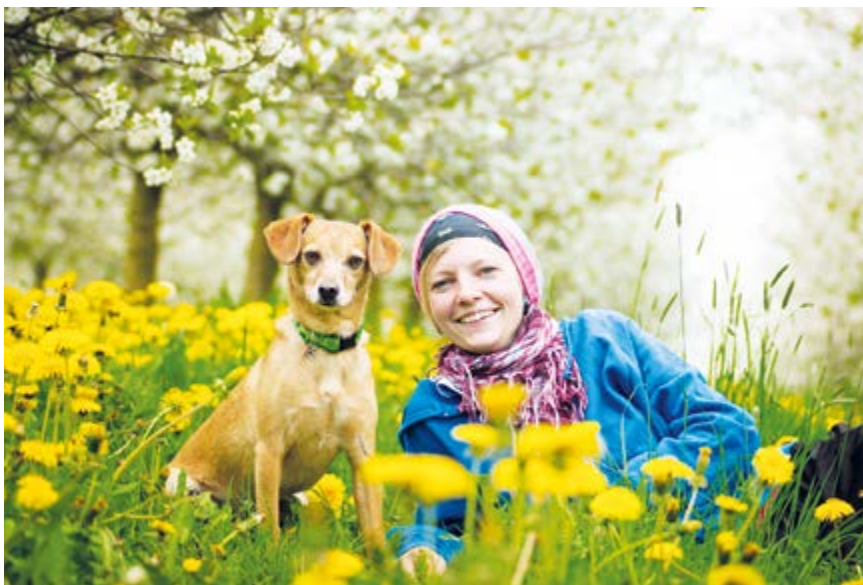
Pro potřeby pejskařů slouží mapa Vše pro pejsky

psů (i zde však musí být pes pod dohledem) a rozmístění zásobníků se sáčky na psí exkrementy. Naleznete ji pod černým QR