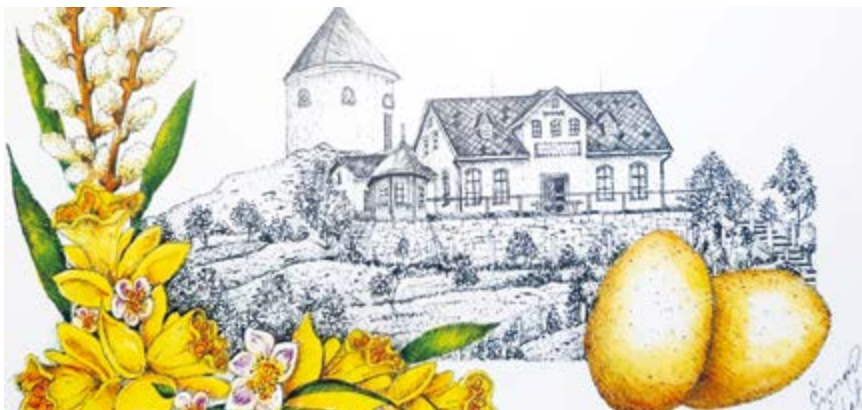
Kresba Šimona Čekala – kolem roku 1911 se na Mědníku nacházel i hostinec

na Mědník pro velikonoční vajíčko. Start je připraven na 5. dubna ze stadionu TJ v čase 8:00 do 9:30 hodin . Do cíle na vrchu Mědník by měli účastníci dorazit nejpozději do 13:00 hodin .