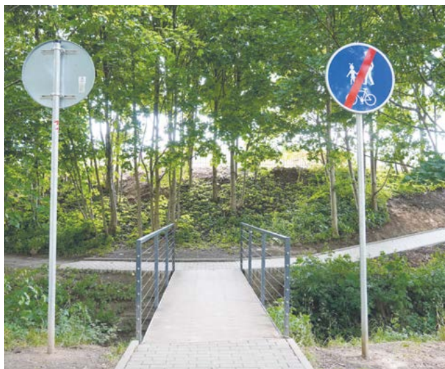
Nové chodníky od lávky přes Klášterecký potok

Ve spolupráci s Lesy ČR byly na naučné stezce Cesta z města vybudovány nové dřevěné lávky přes potoky, které zpříjemní cestu směrem na Měděnec.