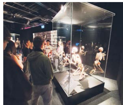
Pražská výstava Body Worlds umožňuje lépe poznat lidské tělo