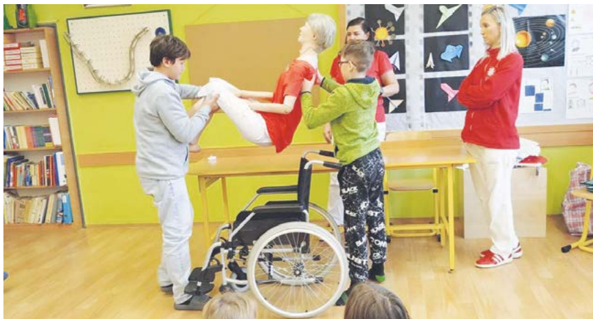
K nácviku manipulace s nemocným pacientem pomohla figurína „Tonda“