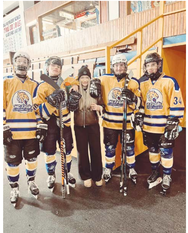
Lili je odchovankyně kláštereckých Tygrů