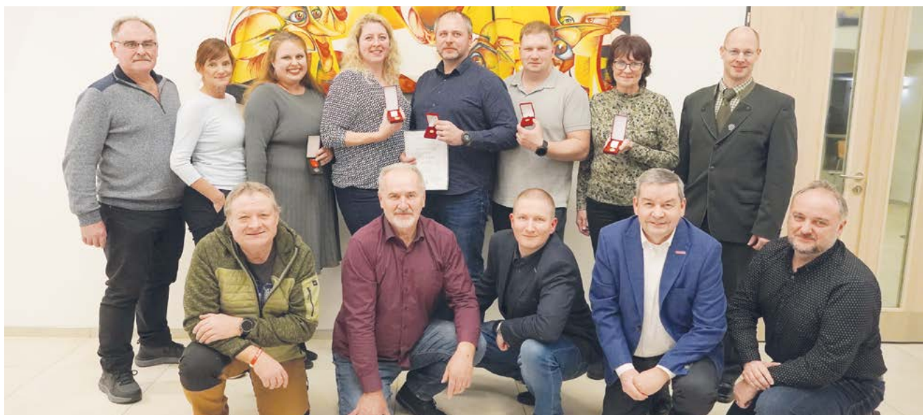
Mezi hrdiny, kteří darují krev, patří i ti z Kláštence nad Ohří