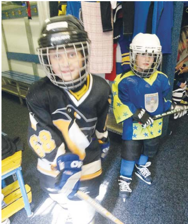
Na led se poprvé postavila ve čtyřech letech