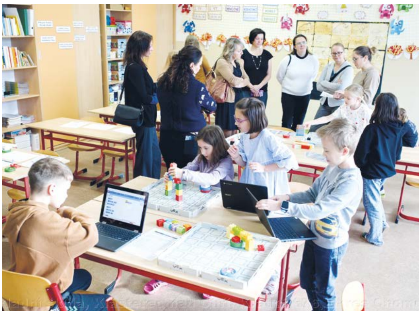
Ukázka práce s nadanými dětmi na ZŠ Krátká