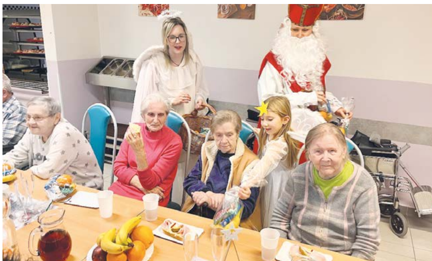
Dobroty z rukou Mikuláše a andělů seniorům chutnaly