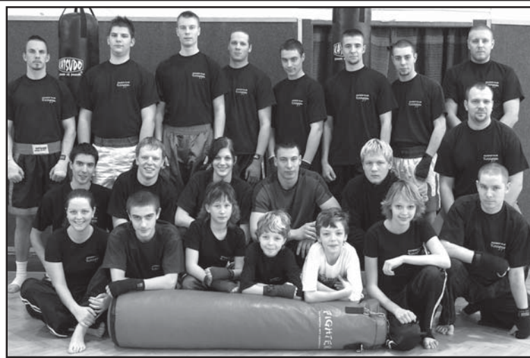
■ SK Kosagym Kadaň