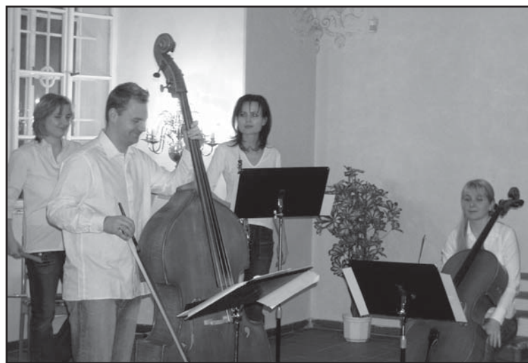
■ Komorní soubor Tilia v renesančním sále kláštereckého zámku

Také v březnu pokračoval na zámku seriál koncertů, který připravuje Základní umělecká škola. Tentokrát se ve velkém renesančním sále představil plzeňský komorní soubor Tilia, vítěz prestižní rozhlasové soutěže žakovských a studentských orchestrů Concerto Bohemia. Mladí hudebníci, bývalí studenti Konzervatoře v Plzni a především vynikající muzikanti, si pro péčeční podvečer připravili svébytně interpretované skladby vycházející z českého a moravského folkloru, doplněné světskou hudbou renesance a baroka. Název souboru Tilia, což znamená v latině lípa, má symbolizovat strom života, trvalé síly a věčné obnovy. Tyto kvality jistě nelze souboru upřít. Z celého vystoupení doslova prýštil elán a chuť hrát. Nadšení, se kterým všichni mladí hudebníci představili například Valašské tance, bylo doslova nakažlivé. Jak se dočteme v jedné z recenzí, které o souboru Tilia vyšly, „je to nefalšované citěný folklor interpretovaný lidmi, kteří si na nic nehrají, jen tuhle hudbu mají rádi a podávají ji, jak ji cítí“. Mladí muzikanti připravili kláštereckým milovníkům klasické hudby další příjemně strávený hudební večer.