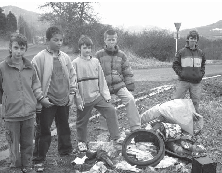
■ Svoje ruce přiložili k dílu při úklidu města i žáci Základní školy praktické