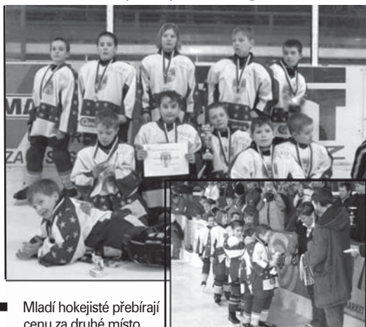
■ Mladí hokejisté přebírají cenu za druhé místo