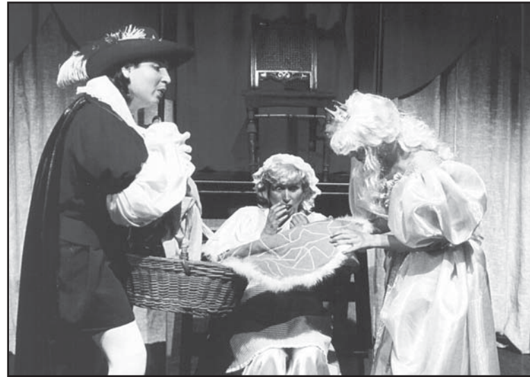
■ Foto z představení Kocour v botách

spojen s kinem, tak se v sobotu pořádala dopolední představení. Děti ale postupně přestaly chodit a program se musel zrušit. Já jsem ale názoru, že by tu podobná nabídka pro děti být měla. Nevzdávám to a věřím, že to tentokrát vyjde,“ říká ředitel kulturního domu. A zatím se zdá, že by se to mohlo podařit. „Na první pohádku přišlo asi padesát dětí a rodičů, od té doby ale ná-