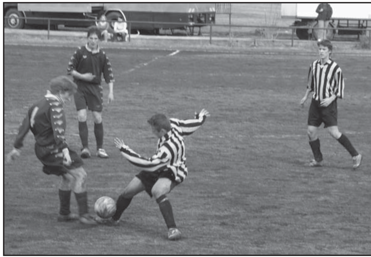
■ Souboj kláštereckého dorosteneckého útoku s hostující obranou

Perštejn doma přivítal jednoho z aspirantů na postup do vyšší soutěže celek Černovic. Po prohraném prvním poločase perštejnští zabrali a nečekaně lídrovi tabulky uštědřili porážku 2:1 (0:1).